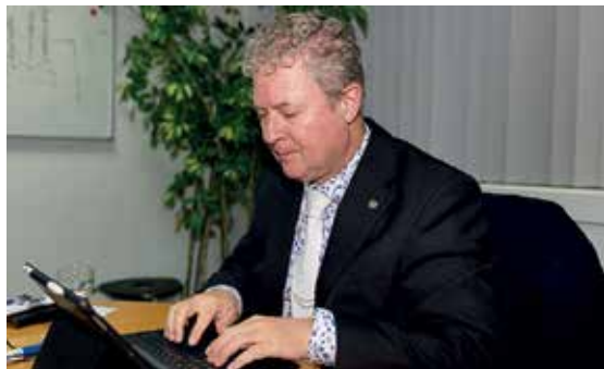
Het zijn lange werkweken maar met veel plezier

Een van de portefeuilles waar je verantwoordelijk voor bent is de ouderenzorg. Hoe zie je de toekomst op dat terrein voor je. Onlangs was de toenemende eenzaamheid onder ouderen een veelbesproken onderwerp in de media. Onderzoek leerde dat anno 2018 tenminste een miljoen mensen zich eenzaam voelen. De verwachting is dat het aantal eenzame mensen alleen maar zal toenemen. Wat kun je daar als wethouder aan doen?